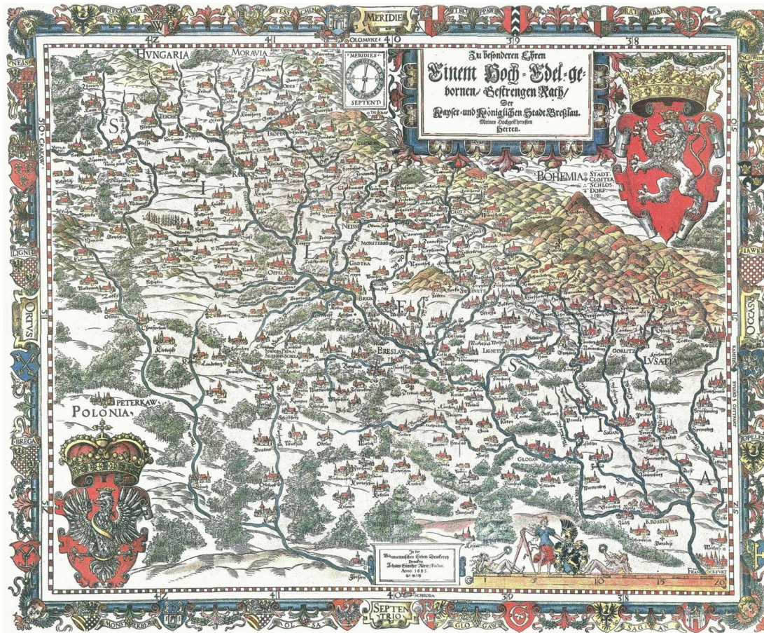
Helwigowa mapa Śląska z roku 1561, wydání z roku 1885

Pierwsza mapa Śląska, Martina Helwiga z 1561 r., domena publiczna