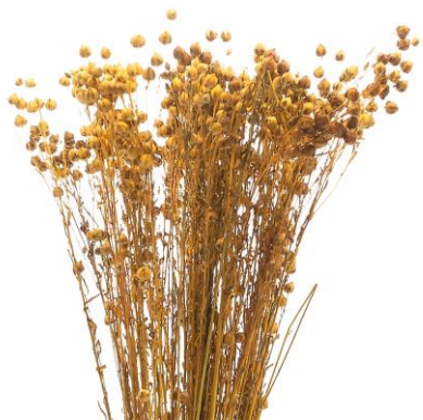
Len - przędza lniana