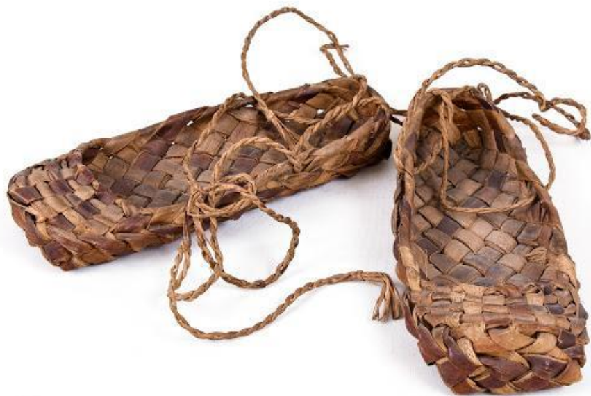
Łapcie z łyka (lipy / wierzby / wiązu / brzozy)