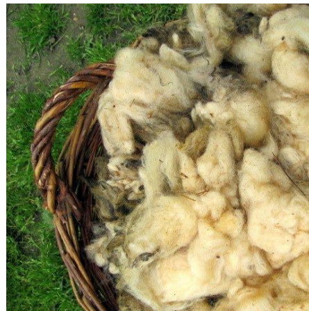
Wełna - przędza wełniana / włóczka