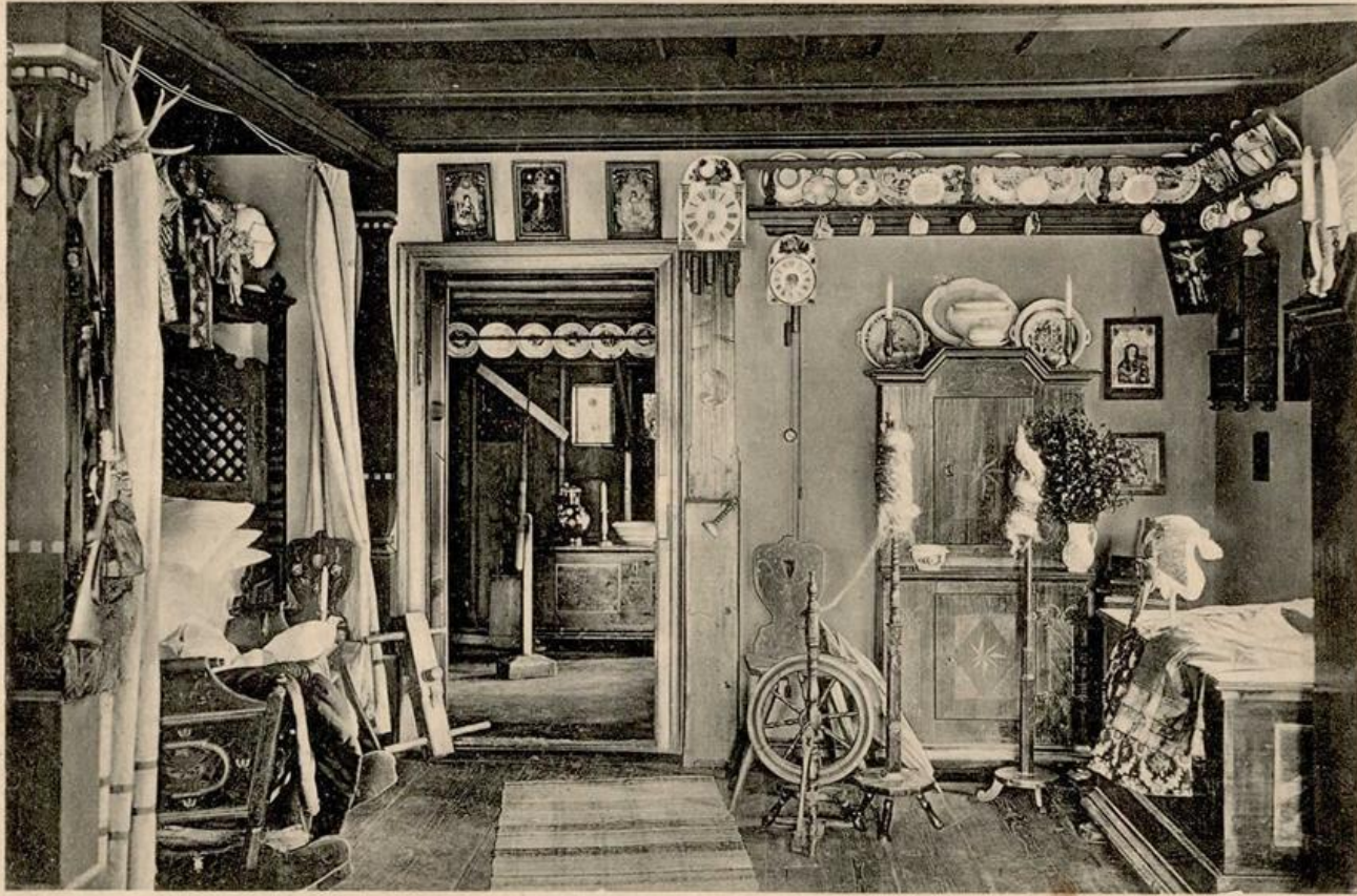
Widok wnętrza śląskiej izby kmiecej z XVIII w. z dawnego muzeum w Karpaczu koło Jeleniej Góry